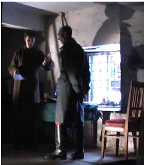
»Generalfeldmarschall Paulus« lernt seinen Text: Vorbereitung auf die Rekonstruktionen der Schlacht von Stalingrad.

Rebekka Blume hat an der Universität Bremen Kulturgeschichte Osteuropas und Geschichte studiert. Seit 2006 arbeitet sie in der deutsch-russischen Geschichtswerkstatt zur Erforschung der Erinnerung an die Schlacht von Stalingrad in Deutschland und Russland mit, die von der Stiftung »Erin-