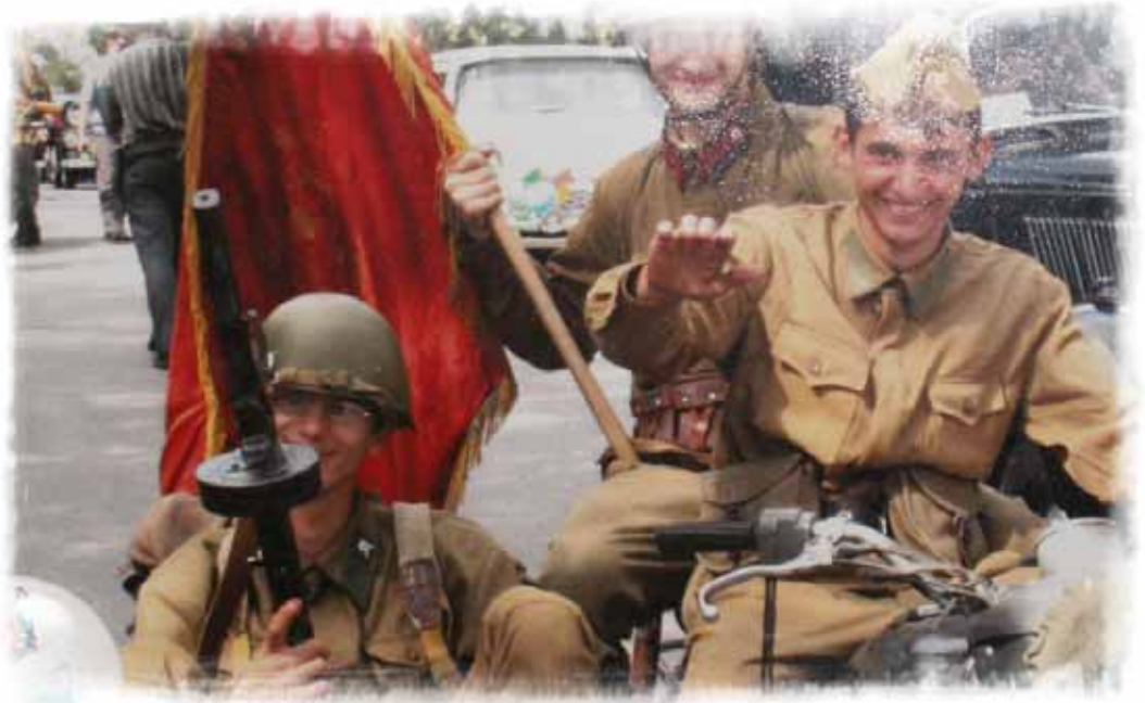
Gruppenbild mit historischen Requisiten: In den Wohnungen der Kriegsspieler, die die Schlacht von Stalingrad nachstellen, hängen Bilder, die sowohl an die Schlacht als auch an ihr Nach-Spiel erinnern.

über die militärhistorischen Rekonstruktionen in Wolgograd gedreht.